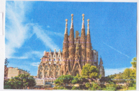
La Sagrada Familia

La Alhambra, un complejo monumental sobre una ciudad andaluza situado en Granada, España, es un monumento famoso. Consiste en un conjunto de antiguos palacios, jardines y fortalezas. Es una de las atracciones turísticas más visitadas de Europa y es Patrimonio de la Humanidad desde 1984. La arquitectura es muy importante para la cultura de España porque es muy famoso y especial y atrae muchos turistas.