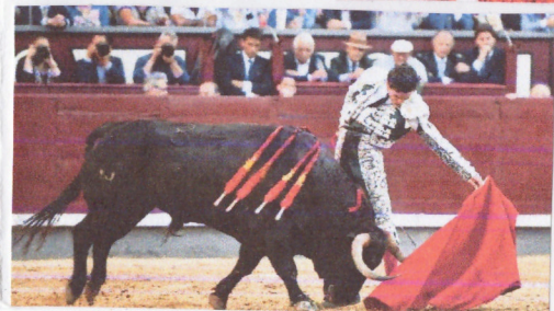
La corrida de toros