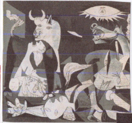
Una parte de la pintura "Guernica"

Y un baile muy famoso es el "Flamenco". Es de Andalucía y nació en el siglo 19. Es una mezcla de la música tradicional andaluza y la música tradicional romaní pero también tiene influencias árabes. El flamenco combina el baile, el canto y la música de guitarra. Es un baile muy emocional.